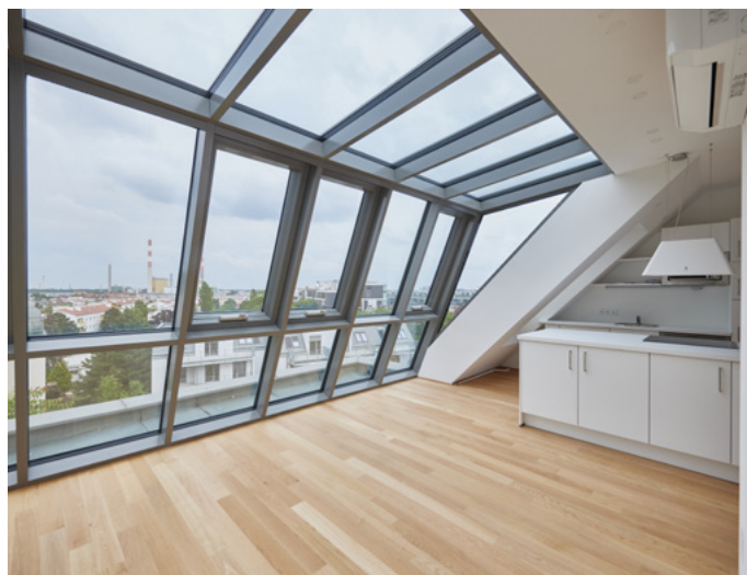
Simmeringer Hauptstraße, Wien

Hinweis: Der Fonds darf seine liquiden Mittel zu mehr als 35 % des Fondsvermögens in Wertpapiere anlegen, die von der Bundesrepublik oder einem der Bundesländer ausgegeben wurden.