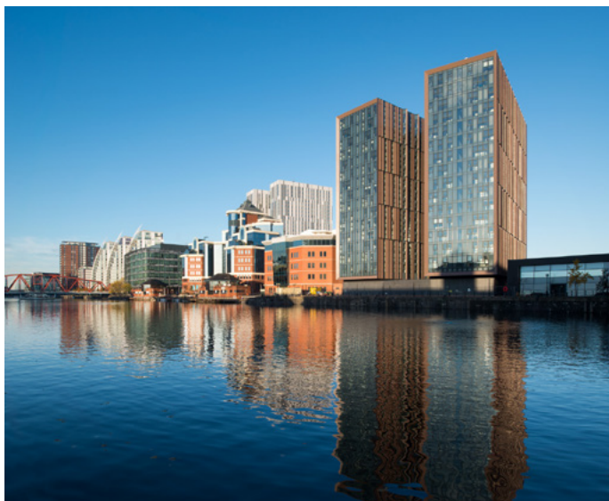
248, The Quays, Manchester