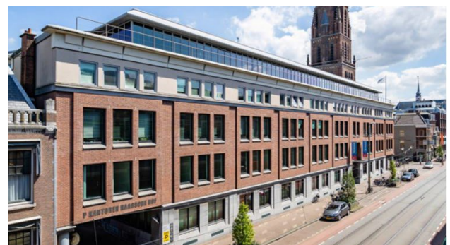
Parkstraat 83, Den Haag

Im vergangenen Herbst konnten zwei bestehende Wohnliegenschaften in Dortmund und Offenbach erworben werden. Ein Wohnblock mit 111 Wohnungen zu durchschnittlich 70 Quadratmetern befindet sich in Dortmund zwischen der Uhland- und Münsterstrasse im Norden der Ruhrmetropole. Das zweite Wohnobjekt steht in Offenbach bei Frankfurt an der Fritz-Remy-Strasse 5-13 und besteht aus zwei freistehenden Wohnblocks, welche 317 Wohnungen zu durchschnittlich 70 Quadratmetern beherbergen. Im Südosten von Frankfurt gelegen, ist dessen