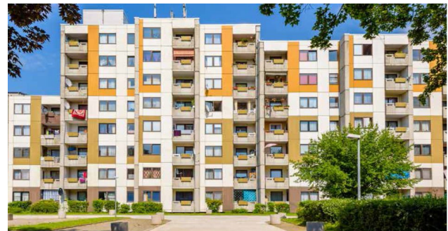
Münsterstrasse 200-204, Dortmund

Stadtzentrum mit öffentlichen Verkehrsmitteln in rund 30 Minuten erreichbar.